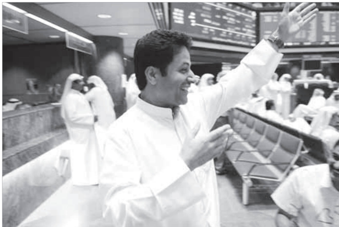
الارتياح الحذر يسود المتعاملين

المؤشرات العامة انخفض المؤشر العام للبورصة 31,4 نقطة ليغلق على 11826,7